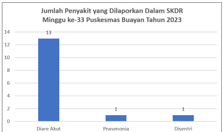
Gb 3. Jumlah Kasus Penyakit Potensial KLB Puskesmas Buayan yang dilaporkan dalam SKDR Minggu ke-33, 2023

Berdasarkan grafik pada Gb 2. terlihat bahwa terdapat 6 kasus penyakit potensial KLB yang dilaporkan dalam SKDR, diantaranya yaitu diare akut, pneumonia, disentri, suspek demam tifoid, suspek campak, dan sindrom jaundice akut. Dari ke-6 penyakit tersebut, 3 besar penyakit yang paling sering terjadi di wilayah kerja Puskesmas Buayan sampai dengan minggu ke-33 Tahun 2023 yaitu diare, pneumonia, dan disentri masing masing kasus sebanyak 164 kasus, 20 kasus, dan 13 kasus.